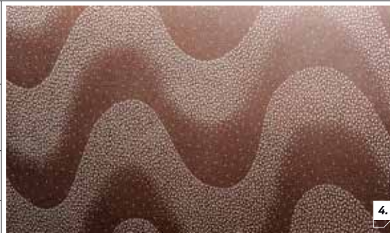
4. DETTAGLIO DI UN FOGLIO. LA DENSITÀ MEDIA DELLE INCISIONI È DI 250 FORI PER CM QUADRO.