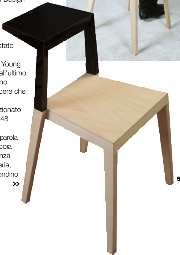
3. Plantpot+, prototipo di vaso con vasoio, realizzato in cemento ductal da Ilcantiere, Italia, entrambi esposti al Salone Satellite 2008. 4.5. 75%-25% Chair, seduta realizzata in legno e plastica riciclata, disegnata per la mostra Redesign your mind 2 a Belgrado, 2008; selezionata per YSD al Salone Satellite 2009. Tutti progetti di od-do arhitekti.