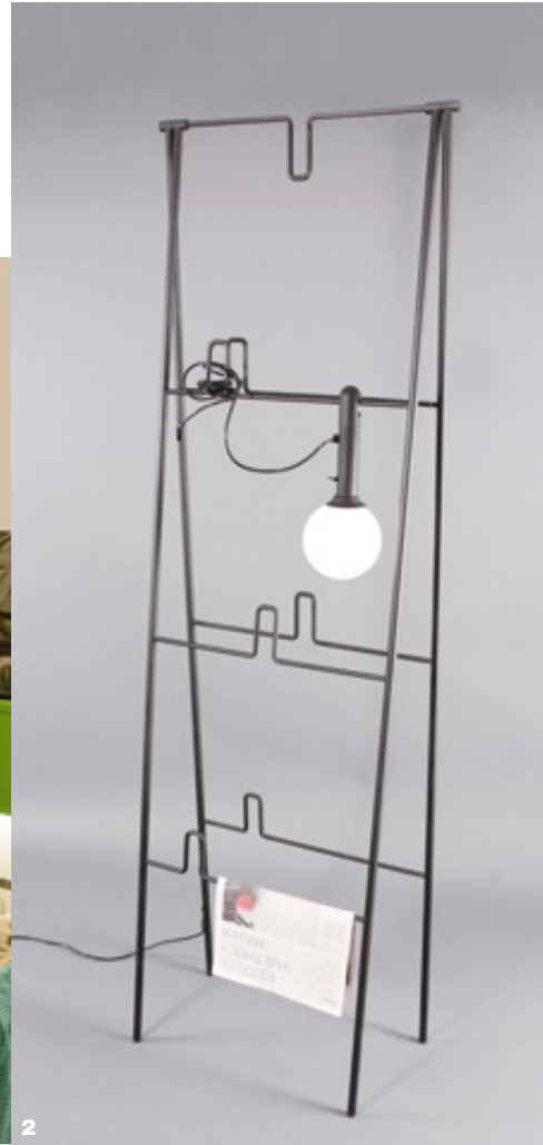
1. Buzz Shop, progetto di interni per un negozio sperimentale multimarca a Belgrado, 2006. 2. Hanger Lamp, piantana - appendino in tondino metallico con lampada volante, in vendita nella galleria Victor-Hunt a Brussels.