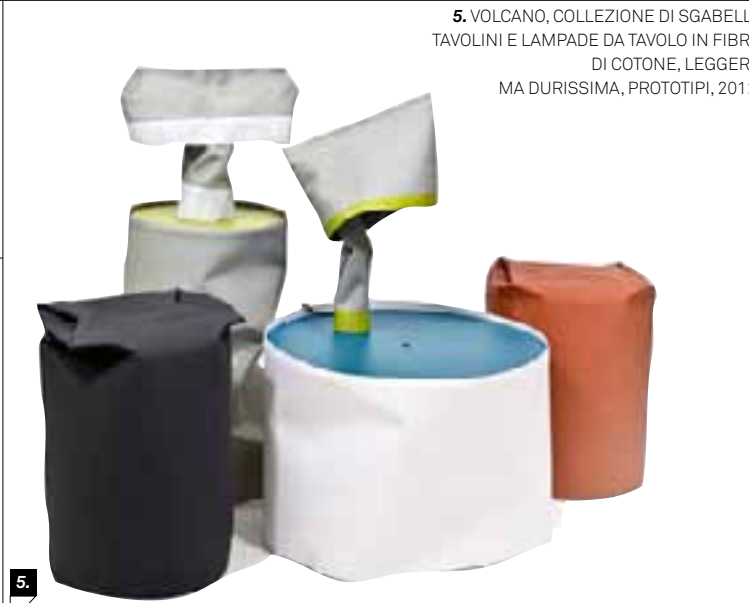
5. VOLCANO, COLLEZIONE DI SGABELLI, TAVOLINI E LAMPADE DA TAVOLO IN FIBRA DI COTONE, LEGGERA MA DURISSIMA, PROTOTIPI, 2012.