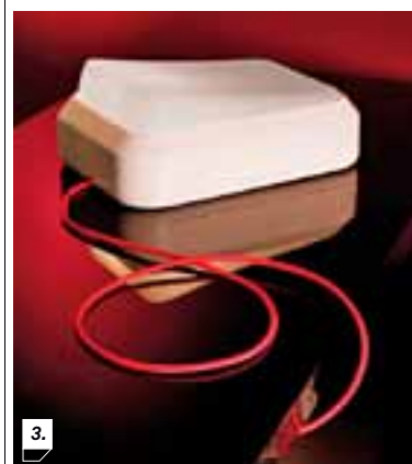
3. CLICK, LAMPADA DA TERRA E PARETE IN ABS E PC, PRODOTTA DA SEGNO, 2010.