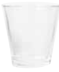
7. TUMBLER, BICCHIERE OTTENUTO FONDENDO LA FORMA DI DUE CLASSICI: IL KARTIO DI KAJ FRANCK PER ITTALA E IL DURALEX PICARDIE, PRODUZIONE MUJI 2011.