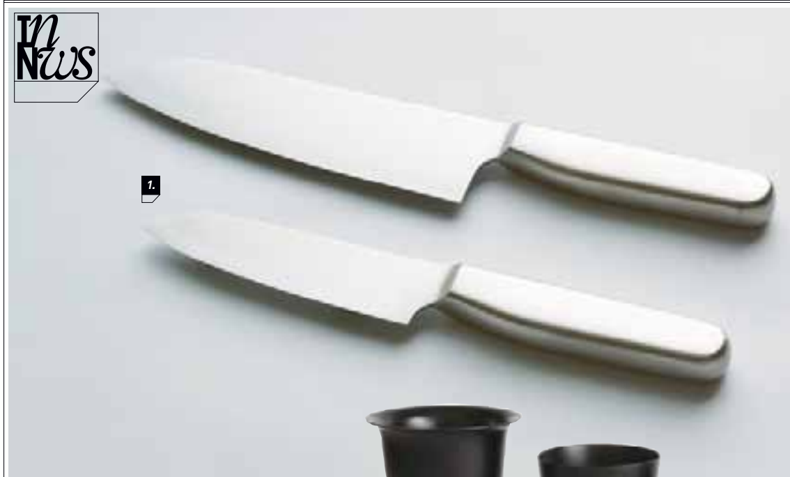
1. COLTELLI DA CUCINA IN ACCIAIO INOX, MUJI, 2010.