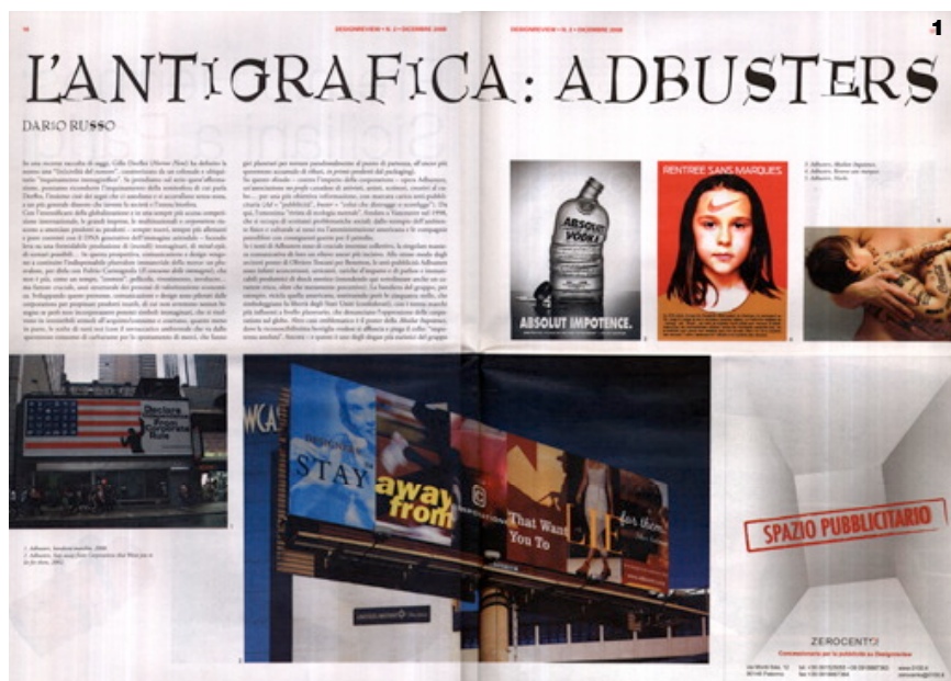
1. Doppiapagina del free magazine Design Review, caporedattore Marinella Ferrara, grafica di Dario Russo, editore Zerocento. 2.3.4. Schermate del sito PaD, grafica di Cinzia Ferrara e Daniele Savasta, foto di Fabio Gambina. 5. Collana di libri "Design", Lupetti-Editori di comunicazione; alcuni titoli hanno superato le 2.500 copie vendute, come 'Corporate Image', di Vanni Pasca e Dario Russo, e altri si stanno avviando agli stessi risultati come 'Materiali intelligenti, sensibili, interattivi' di Marinella Ferrara e Marco Cardillo, o 'La comunicazione dei beni culturali' di Cinzia Ferrara.