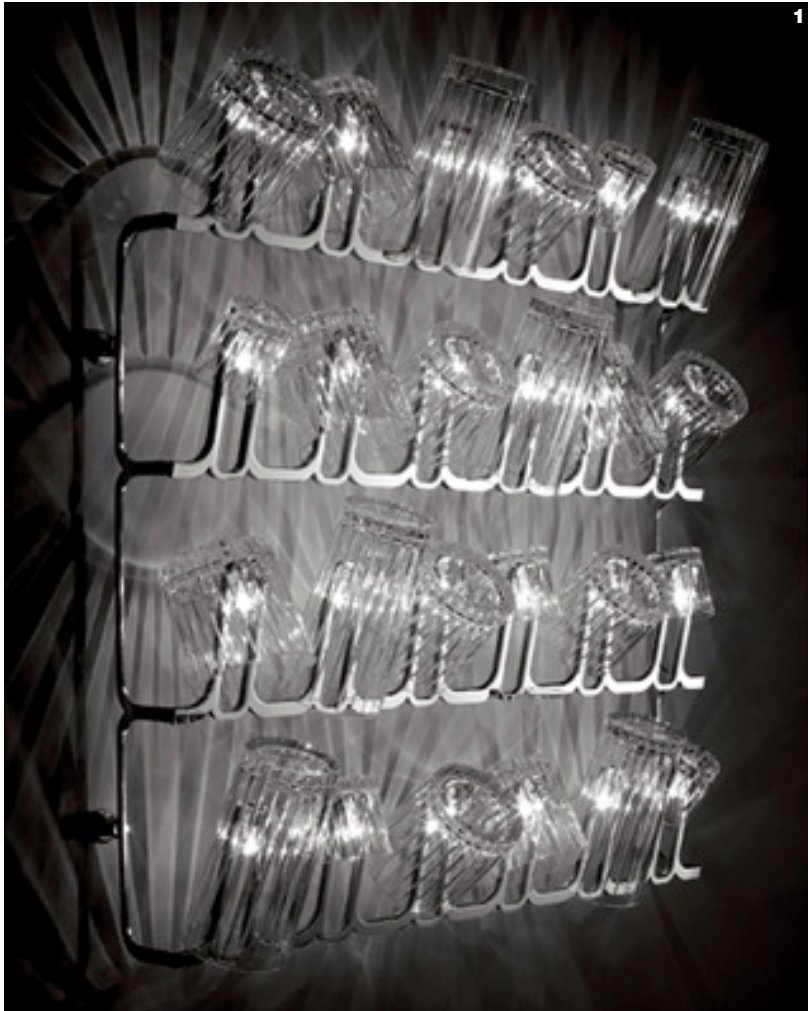
1. Dono, sistema di lampade a sospensione, parete e tavolo con bicchieri in cristallo usati come diffusori di luce, Fabbian Illuminazione, 2005.