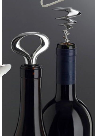
4. Collezione Sommelier, Helix cavatappi e Twist tappo, De Vecchi argenti, 2006.