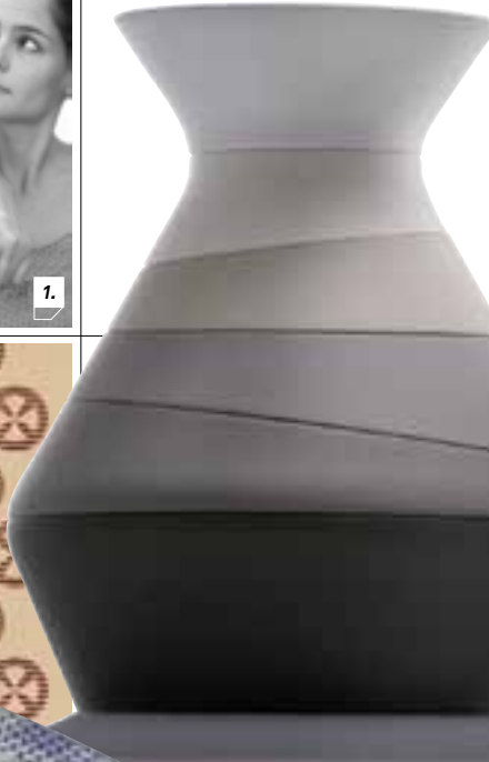
2. SKINS, PROPOSTE GRAFICHE PER TESSUTI DA ABBINARE ALL'ARREDO DI INTERNI, PER MORI TESSUTI, 2011.