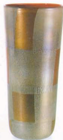
Maniglia per mobili "Twist", Pamar, 2005; vaso "Torcello", 2004, Venini; divano "Milano", 2005, Minotti.

Per anni il letto ha risentito del gusto 'arabo', è diventato una sorta di boudoir; sono poche le aziende che non hanno ceduto a un gusto esuberante, falsamente ricco... un vero letargo mentale! Infine si è iniziato a fare il letto imbottito: non più sommier o legno, ma letto tessile, magari legato anche alle tende, ai tessuti d'arredo. La rivoluzione della Flou e di Magistretti, con il letto Nathalie, 25 anni fa, consiste nell'aver dato corpo a una nuova tipologia. Nathalie era semplice, immediato, ma con