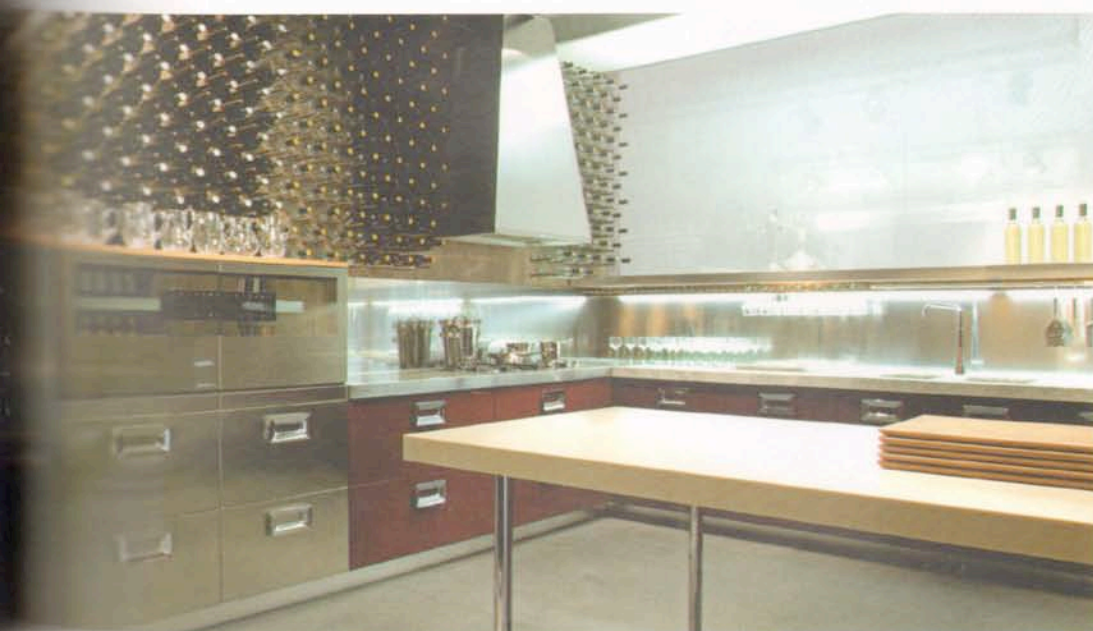
On this page: "Barrique" kitchen, Ernestomeda, 2006; "Alicudi" bed, 2001, Flou; "Van Dick" table and "Roma" chairs, Minotti.